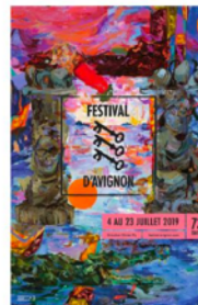
Festival d'Avignon échelle locale (Avignon)