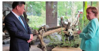
Partenariat culturel : « diplomatie du panda » (Chine) : prêt de deux pandas chinois à l'Allemagne en juillet 2017 échelle internationale (Relations bilatérales : Chine/ Allemagne)