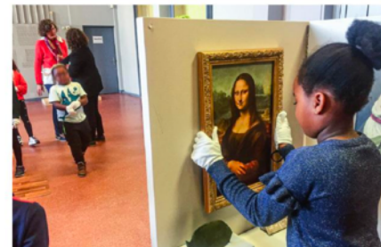
Ateliers éducatifs dans les musées ex : Petite Galerie du Louvre échelle locale (Musée du Louvre)