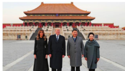
Accords commerciaux : voyage de Trump en Chine en 2017, visite de la Cité interdite : 253,4 milliards de dollars de contrats échelle internationale (Relations bilatérales : Chine/ États-Unis)