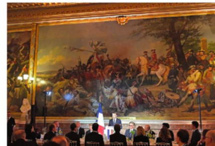
Emmanuel Macron reçoit, en janvier 2018, à Versailles 200 chefs d'entreprise étrangers pour promouvoir l'intérêt d'investir en France (« Choose France ») échelle internationale (France-international)