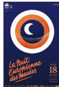
Nuit européenne des musées échelle européenne