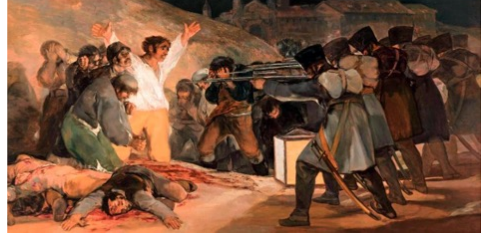
Francisco de Goya, Tres de Mayo , 1814, Musée du Prado (Madrid)